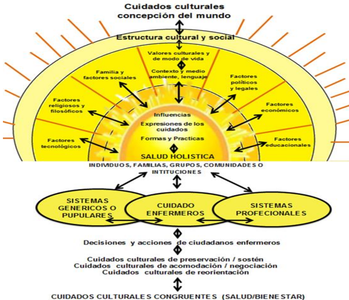
Figura 1 Modelo del Sol Naciente de Leininger. (Madeleine Leininger, 2004)

En la década de 1970 Leininger elaboró el modelo del sol naciente para representar los componentes esenciales de la teoría (Fig. No.1).